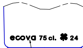
DETALLE DE GRABADO

INSCRIPCION, LOGO, Y N° DE MOLDE GRABADO EN UN SOLO FRENTE