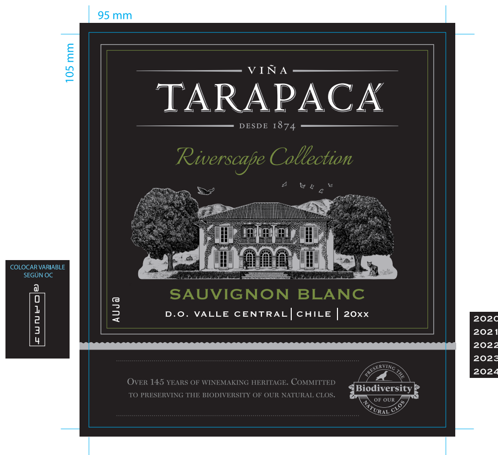
IMAGEN EXCLUSIVA PARA ESTE IMPORTADOR

Archivo preparado por: Karen Restelli / karastelli@vspt.cl