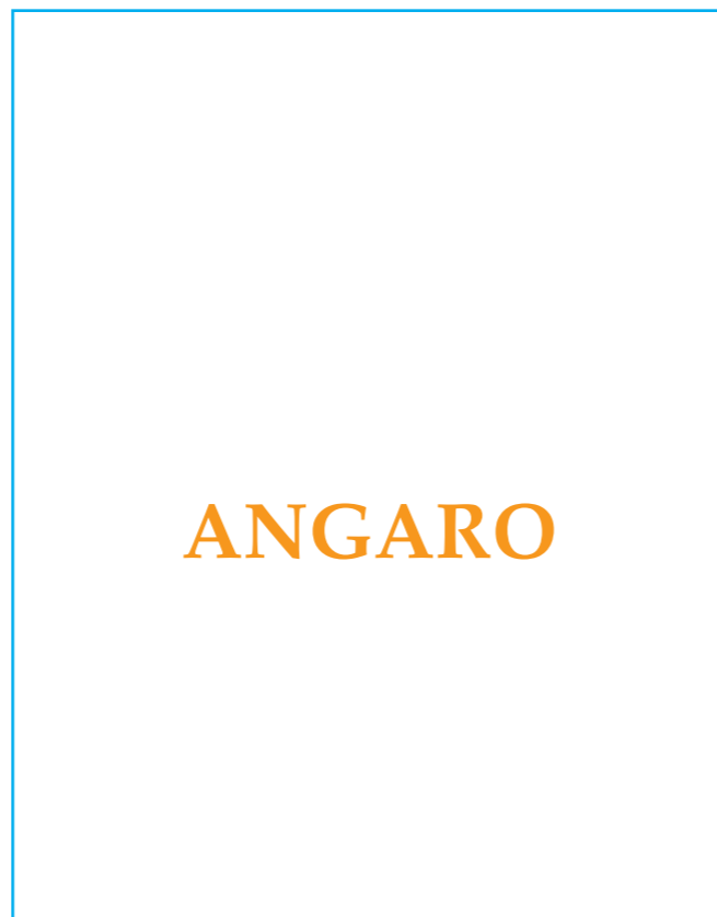
Serigrafía de alto relieve

ALC. 12º VOL ALC. 12,5º VOL ALC. 13º VOL ALC. 13,5º VOL ALC. 14º VOL ALC. 14,5º VOL