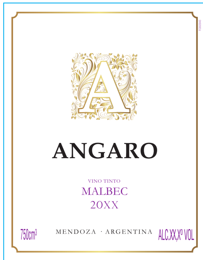
Simulación en color

ALC. 12º VOL ALC. 12,5º VOL ALC. 13º VOL ALC. 13,5º VOL ALC. 14º VOL ALC. 14,5º VOL