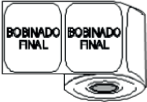
BOTELLA BURDEOS CUYANA