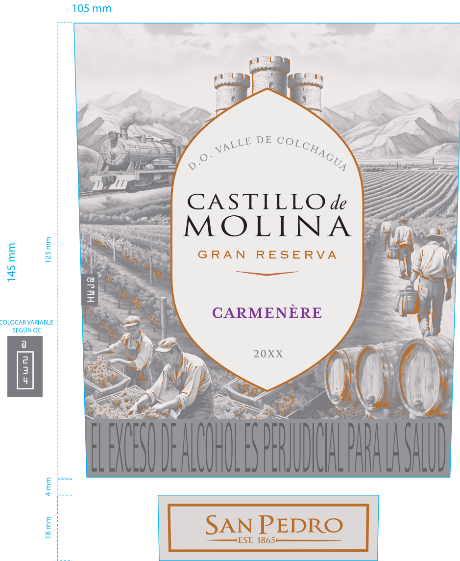
Aplicación Folia Cobre. Escala 50%

Archivo preparado por: Madeleine Espíndola / mespindl@vspt.cl