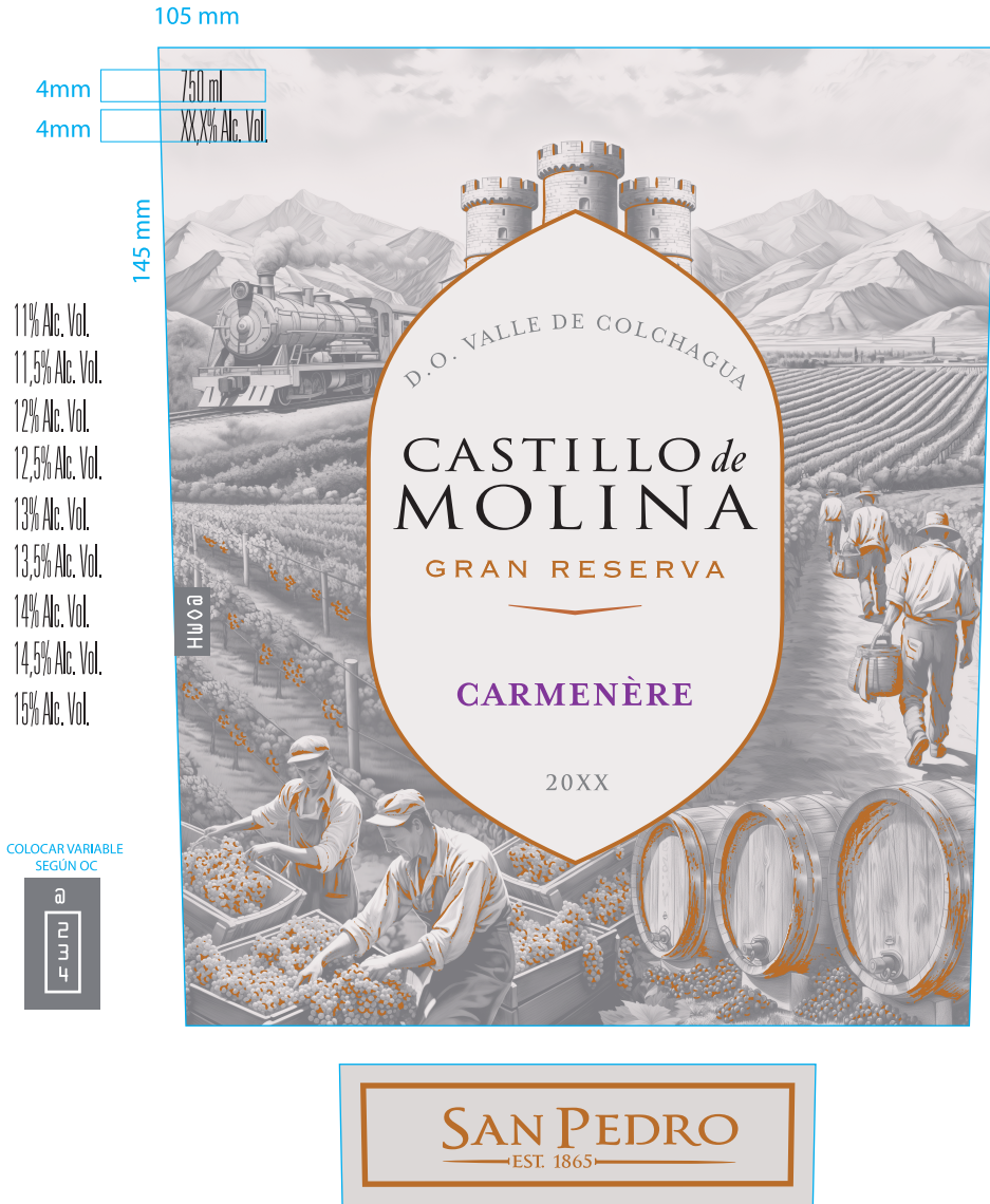
Aplicación Folia Cobre. Escala 50%

Archivo preparado por: Madeleine Espíndola / mespindl@vspt.cl