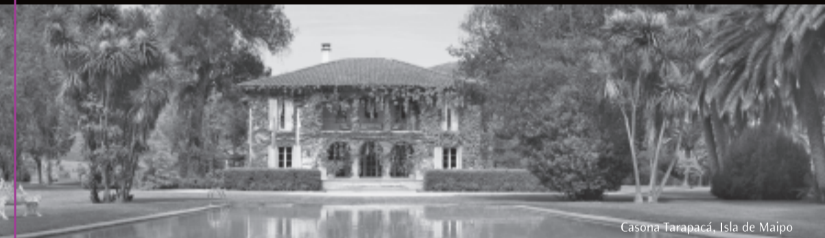
Casa Tarapacá, Isla de Maipo