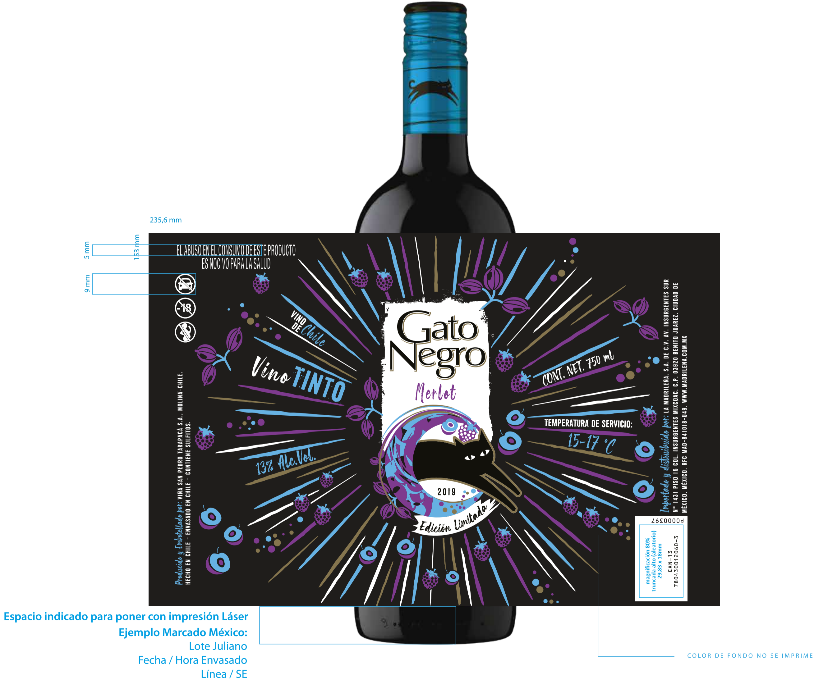
Aplicación tinta oro Esc. 50%