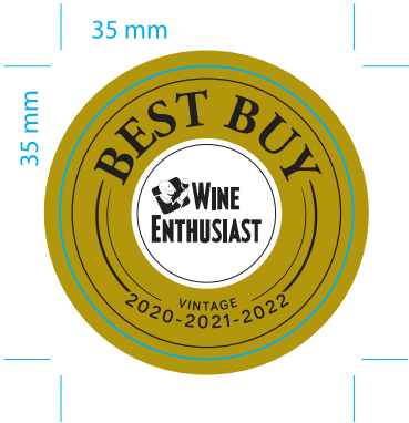
Aplicación Folia Dorada

Archivo preparado por: Camila Orozco / caorozc@vspt.cl