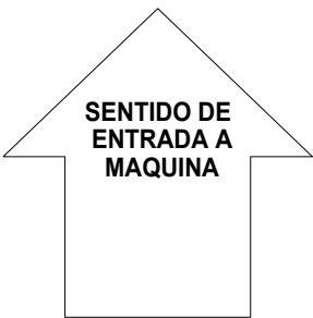
Configuracion de Matriz