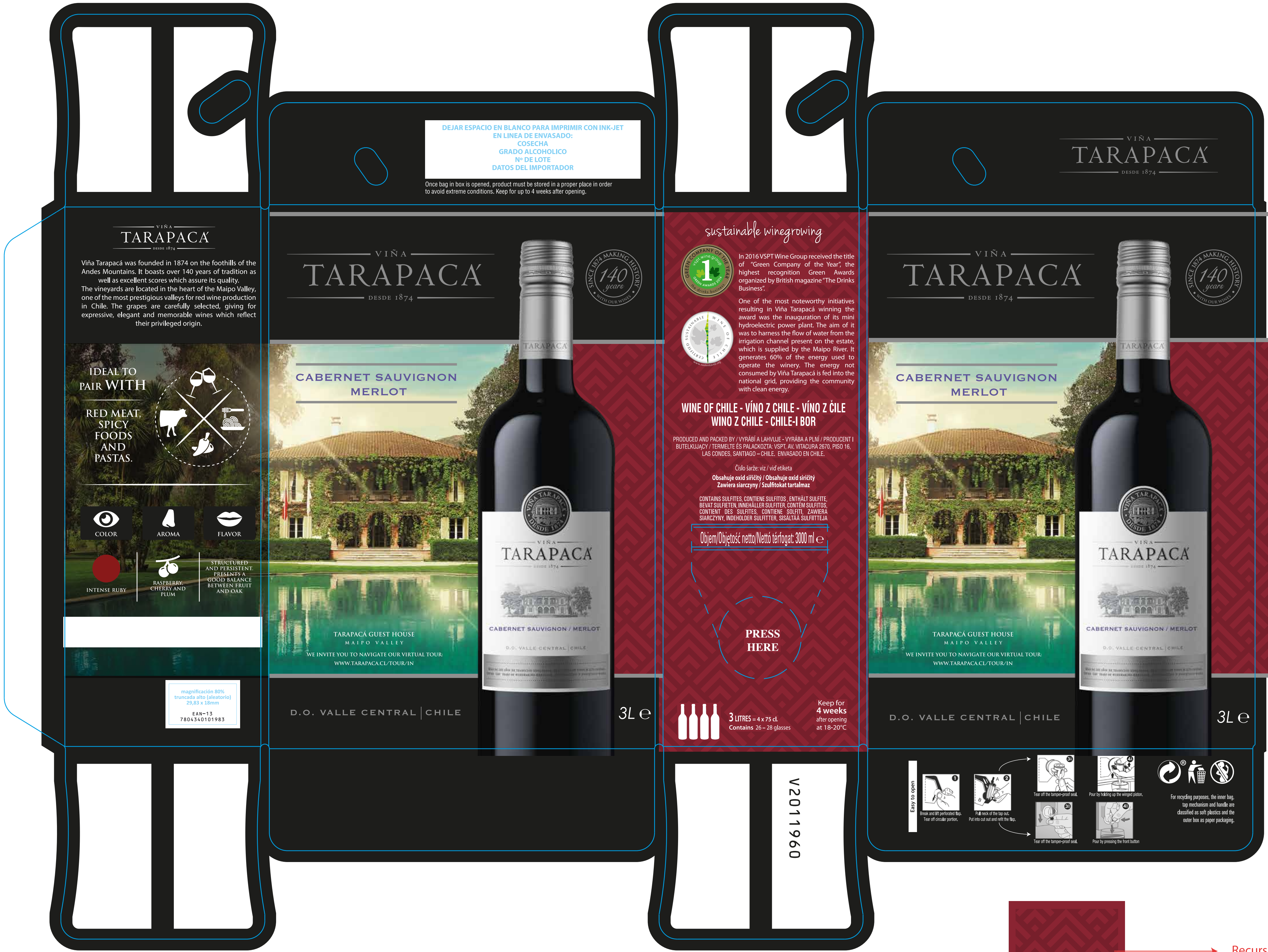
Aplicación Barniz UV Brillante Esc: 40%