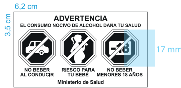
ADVERTENCIA LEGAL al 100%

103,5 x 114 mm = 11.799 mm 15% superficie total = 1.796 mm 30% superficie = 3.539 superficie 62 x 35 mm = 2.170 mm (escala de advertencia a 100% tamaño original)